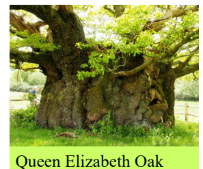
Queen Elizabeth Oak