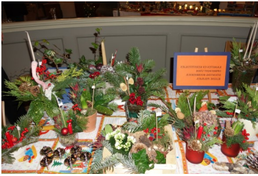
Met een kraampje op de Kerstmarkt

Door projectontwikkelaars een lijst van relatief simpele ontwerpelementen te presenteren die samen een meerwaarde opleveren, zien zij in dat hun ontwikkelingen echt bijdragen aan een groene, natuurinclusieve en daarmee leefbare stad.'