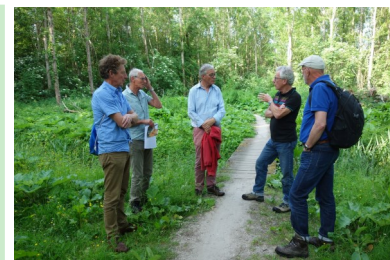
Leden van de Natuurkamer inspecteren de bomen in de Broekpolder.