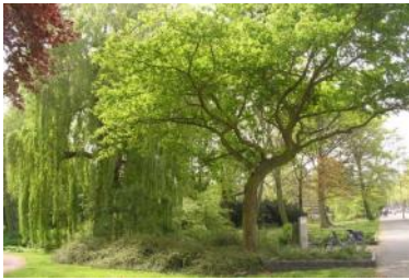
't Hof... zoals het was. Renovatie doet pijn