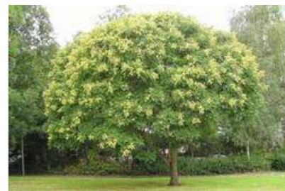
Prachtige boom bij de Dirk de Derdelaan

Toch constateren we dat de inbreng van onze stichting wel degelijk een plaats heeft gekregen in het algemene bomenbeleid en natuurlijk zullen we dit beleid zeer kritisch blijven volgen.