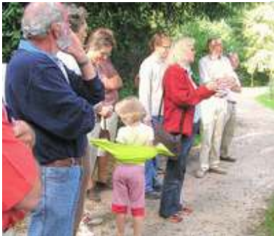
Rondleiding door Het Hof

“Als resultaat van onze gesprekken over de nieuwbouw zijn door diverse aanpassingen meer bomen gespaard dan aanvankelijk de bedoeling was.”