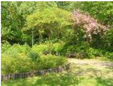
Het parkje tegenover de Blois van Treslongflat

“Met veel energie en enthousiasme doen we dit met elkaar. Het is soms wat veel, maar we doen het graag. Toch hebben we soms handen tekort. We zoeken dan ook nog mensen die ons willen helpen.”