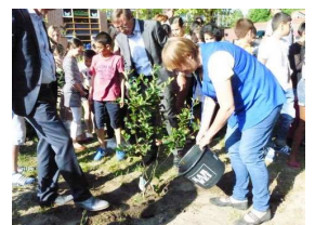
Voor een groene speelplaats