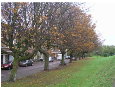
Kastanjes aan de Dijklaan. Er blijven er maar twee over...

Bij het horen van deze sombere boodschap slaat de schrik je om het hart.