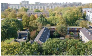
Een groene, bomenrijke leefomgeving in wijk Holy

Allemaal redenen waarom de hoeveelheid groen en bomen zelfs zou moeten toenemen in plaats van afnemen.