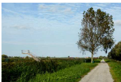
Deze boom bleef behouden