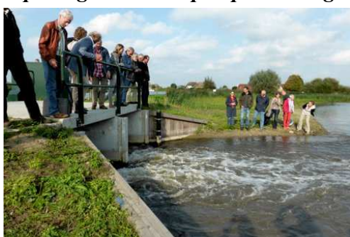
De sluizen gaan open