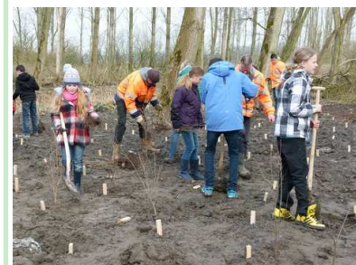
Boomplantdag 2013 Kinderen planten een boom in de Broekpolder