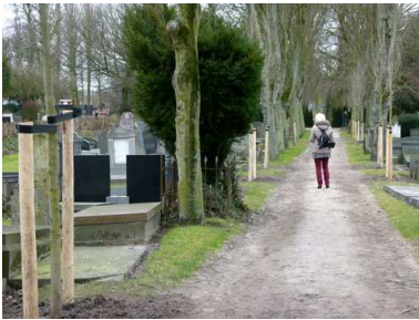
Laan op begraafplaats Emaus na de herinrichting

Een stad zonder bomen zal nooit duurzaam zijn.