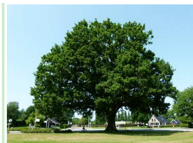
De dikke eik van Beilen Plantjaar 1700-1800 Oudste geregistreerde grensboom in Nederland

Behoud van de hoogstamboomgaard vergt een inspanning die de dragende schouders van 3 gewone burgers verre te boven gaat