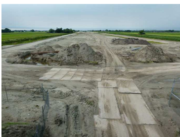
Het voormalig groen paradijs...