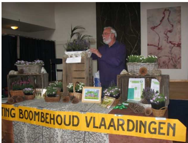
Stichting Boombehoud in de Windwijzer: Groene Morgen!

PARADIJS (Vrij naar "Paradise" van John Prine)