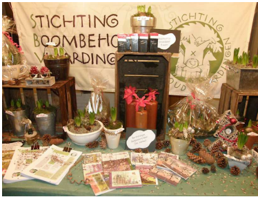
Stichting Boombehoud op de kerstmarkt.